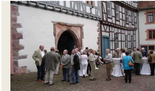
Kellereihof in Michelstadt