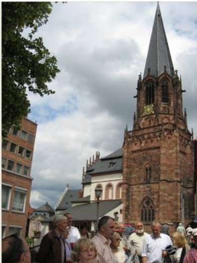
Tausendjährige Stiftskirche in Aschaffenburg