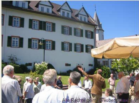
Führung vor dem Schloss Schönberg

Auf eine überwältigende Resonanz stieß die 44. Kurztagung des Breuberg-Bundes, die dieses Jahr in Schönberg bei Bensheim stattfand. Entsprechend der überregionalen Ausrichtung des Breuberg-Bundes als historische Vereinigung für den Odenwaldraum und seine Randlandschaften spannte sich der Bogen der Teilnehmer von Worms bis Würzburg und von Gelnhausen bis Karlsruhe.