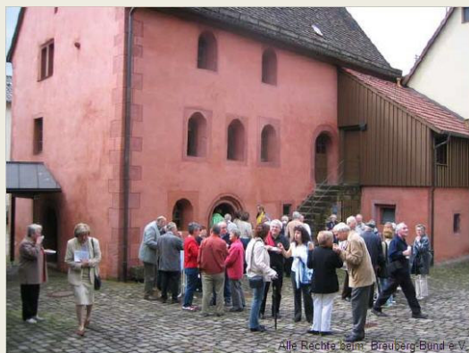
Hühnerfautei in Schönau

Aus dem Raum zwischen Frankfurt und Karlsruhe sowie Würzburg und Worms kamen die Teilnehmer der Kurztagung 2005 des Breuberg-Bundes am 22. Mai in dem badischen Klosterstädtchen Schönau zusammen. Etwas über 100 Geschichtsfreunde hatten sich in der so genannten Hühnerfautei eingefunden, einem 1250/51 errichteten romanischen Steinhau, das in jüngerer Zeit für multikulturelle Zwecke restauriert und ausgebaut wurde.