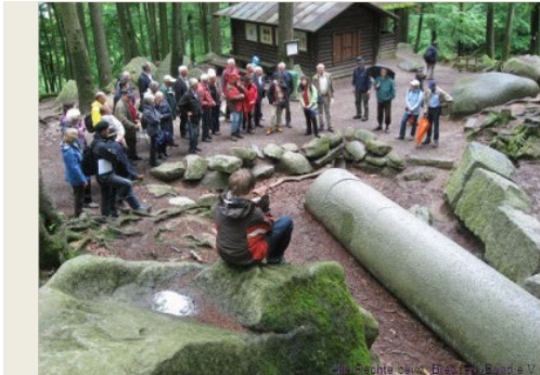
27,5 Tonnen Siegesäule im Felsenmeer Römerzeit, Geologie und Sozialgeschichte